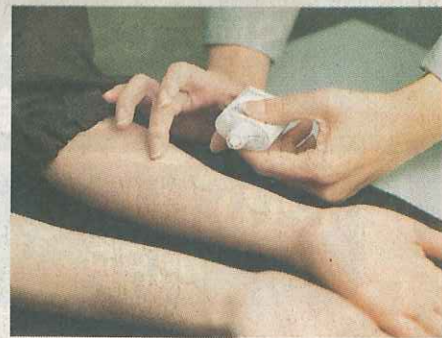
▲為減低被瘧疾蚊叮的機會，應每隔數小時重複塗抹驅蚊劑，以策安全。

包內應有傷風感冒藥、止瀉藥、止嘔藥、腸胃藥。另外亦要帶備蚊怕水、止癢膏和眼藥水。「處理創傷方面，可帶備繃帶、藥水、膠布和剪刀，亦應帶備探熱針和防曬用品。藥物最好經醫生處方，因為可講解分量和使用方法。」