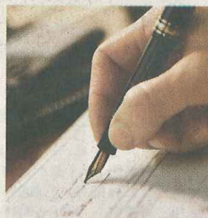
◀長期病患者應在出門前，把所患的病和正服食的藥物寫在紙上，並隨身攜帶，一旦病發便可及早取得藥物。